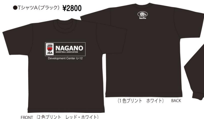
FRONT (2色プリント レッド・ホワイト)